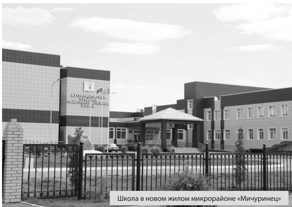
Школа в новом жилом микрорайоне «Мичуринец»

ем панелей 25-й серии во всех районах Воронежской области. Был возведен также жилой комплекс в с. Комаричи Брянской области. С переходом на производство сборного железобетона предприятие участвовало в строительстве школ и других социальных объектов в нашем регионе.