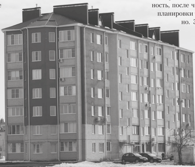
Жилой дом на 70 квартир