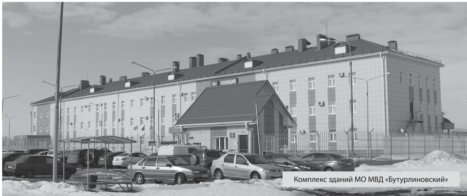
Комплекс зданий МО МВД «Бутурлиновский»