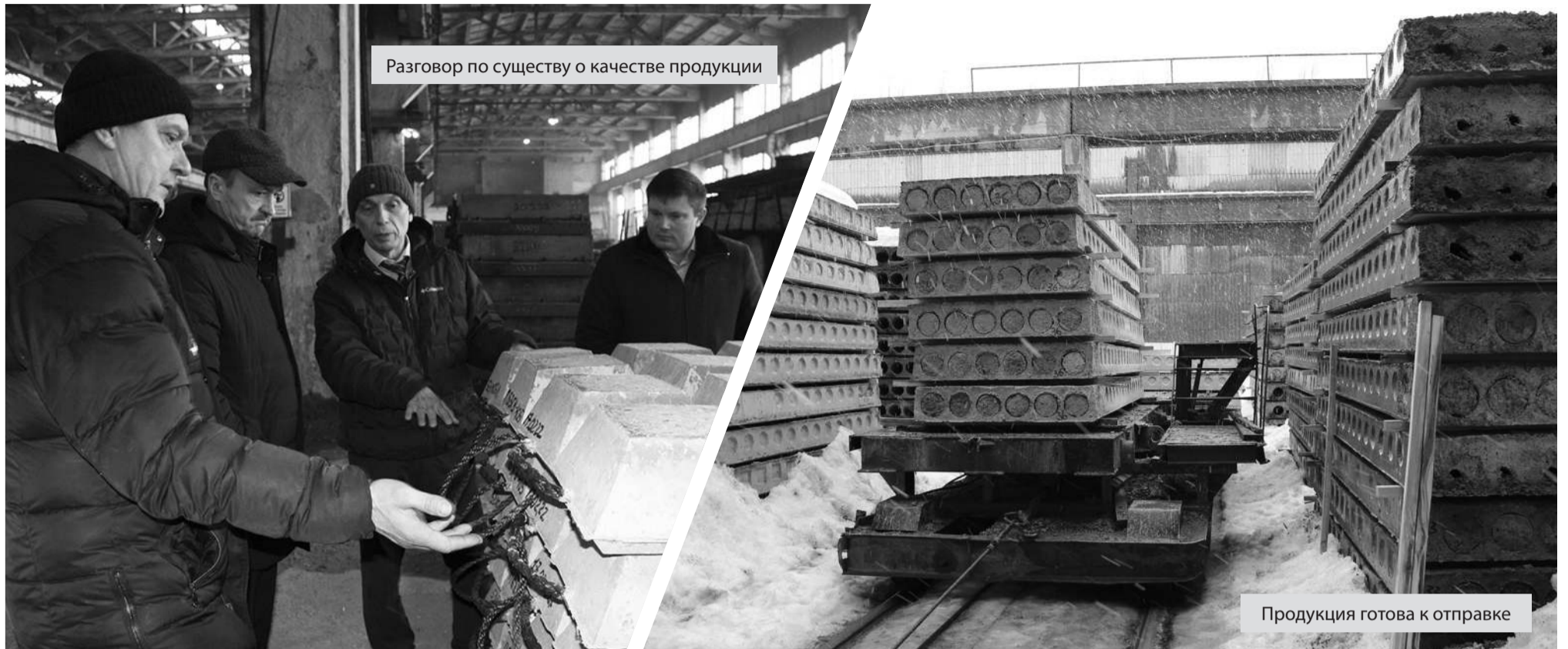
Разговор по существу о качестве продукции