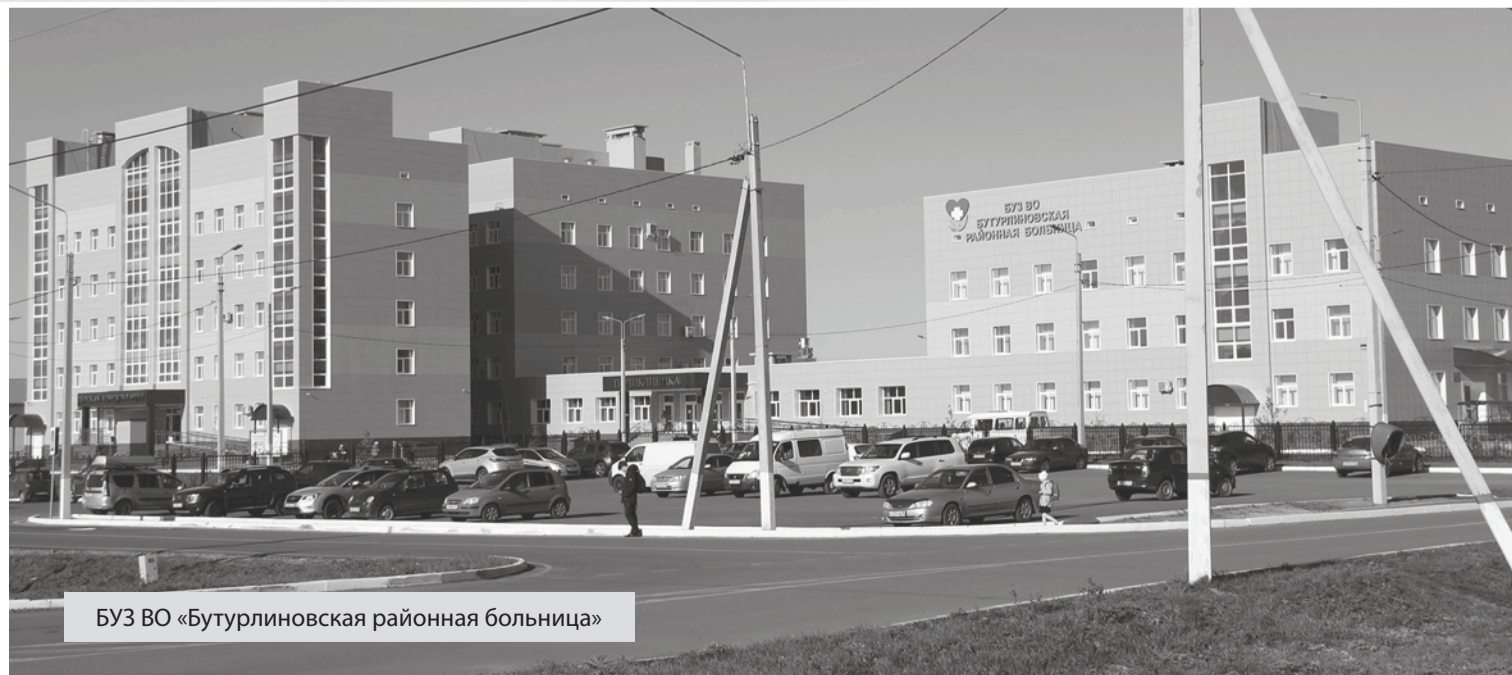
БУЗ ВО «Бутурлиновская районная больница»