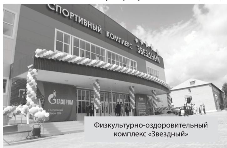
Физкультурно-оздоровительный комплекс «Звездный»

Что примечательно, в этом микрорайоне есть целый земельный массив для развития малоэтажного жилищного строительства. И у Юрия Ивановича Матузова – прекрасная идея на этот счет: уже в нынешнем году построить здесь первые коттеджи для врачей, то есть тех специалистов, которые сегодня необходимы району в первую очередь. Думаю, что это хороший стимул для привлечения в район кадров, а в целом – правильное решение демографической проблемы. Этот и подобные примеры как нельзя лучше характеризуют курс, который выбрала администрация района на создание нормальных социально-экономических условий с тем, чтобы сюда приезжали и иные специалисты из других регионов. Таких примеров у нас в области единицы.