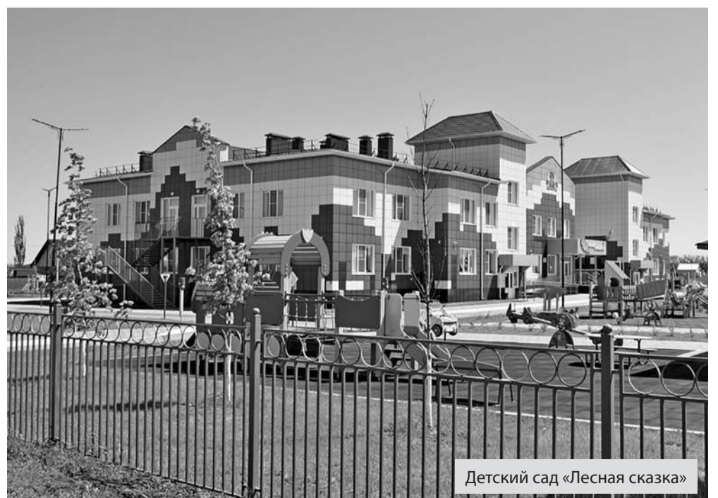
Детский сад «Лесная сказка»