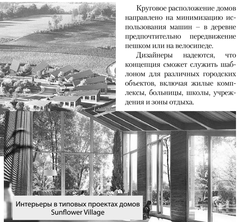
Интерьеры в типовых проектах домов Sunflower Village

мире целостной домашней оздоровительной платформой, предназначенной для пассивного улучшения здоровья и благополучия человека за счет очистки воздуха, фильтрации воды и освещения, имитирующего естественный дневной свет.