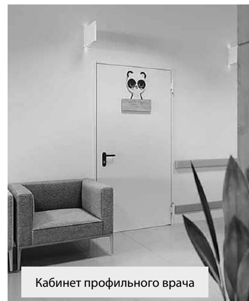
Кабинет профильного врача