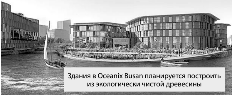
Здания в Oceanix Busan планируется построить из экологически чистой древесины

Повышение уровня моря является реальной угрозой человечеству, которую, по мнению многих экспертов, можно устранить с помощью строительства плавучих городов. Программа ООН-Хабитат, компании Bjarke Ingels Group, SAMOO (Samsung Group), Oceanix и другие объединили свои усилия для дальнейшего изучения этого вопроса и планируют построить прототип плавучего города в Южной Корее.