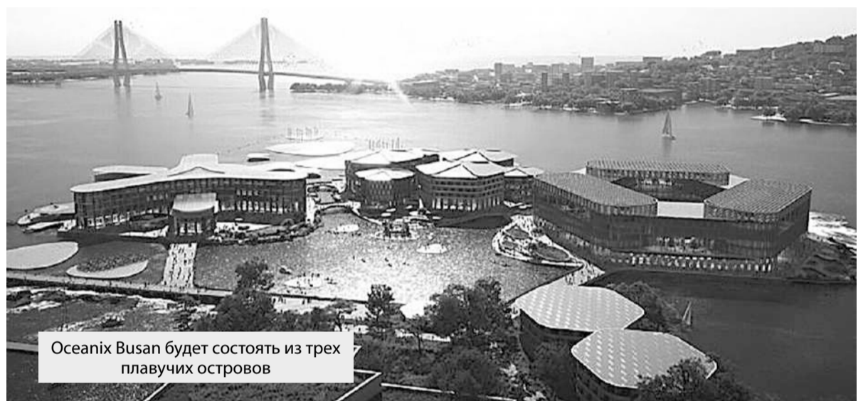
Oceanix Busan будет состоять из трех плавучих островов

Проект был впервые представлен еще в 2019 году, но с тех пор получил значительное развитие. Первоначальный прототип называется Oceanix Busan в связи с его запланированным расположением у побережья южнокорейского города Пусан.