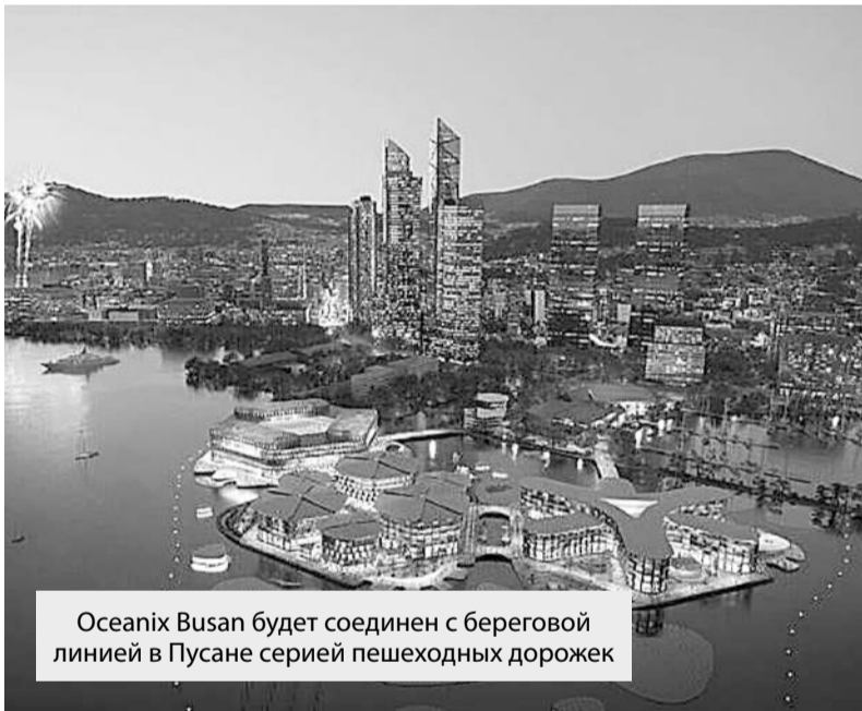
Oceanix Busan будет соединен с береговой линией в Пусане серией пешеходных дорожек